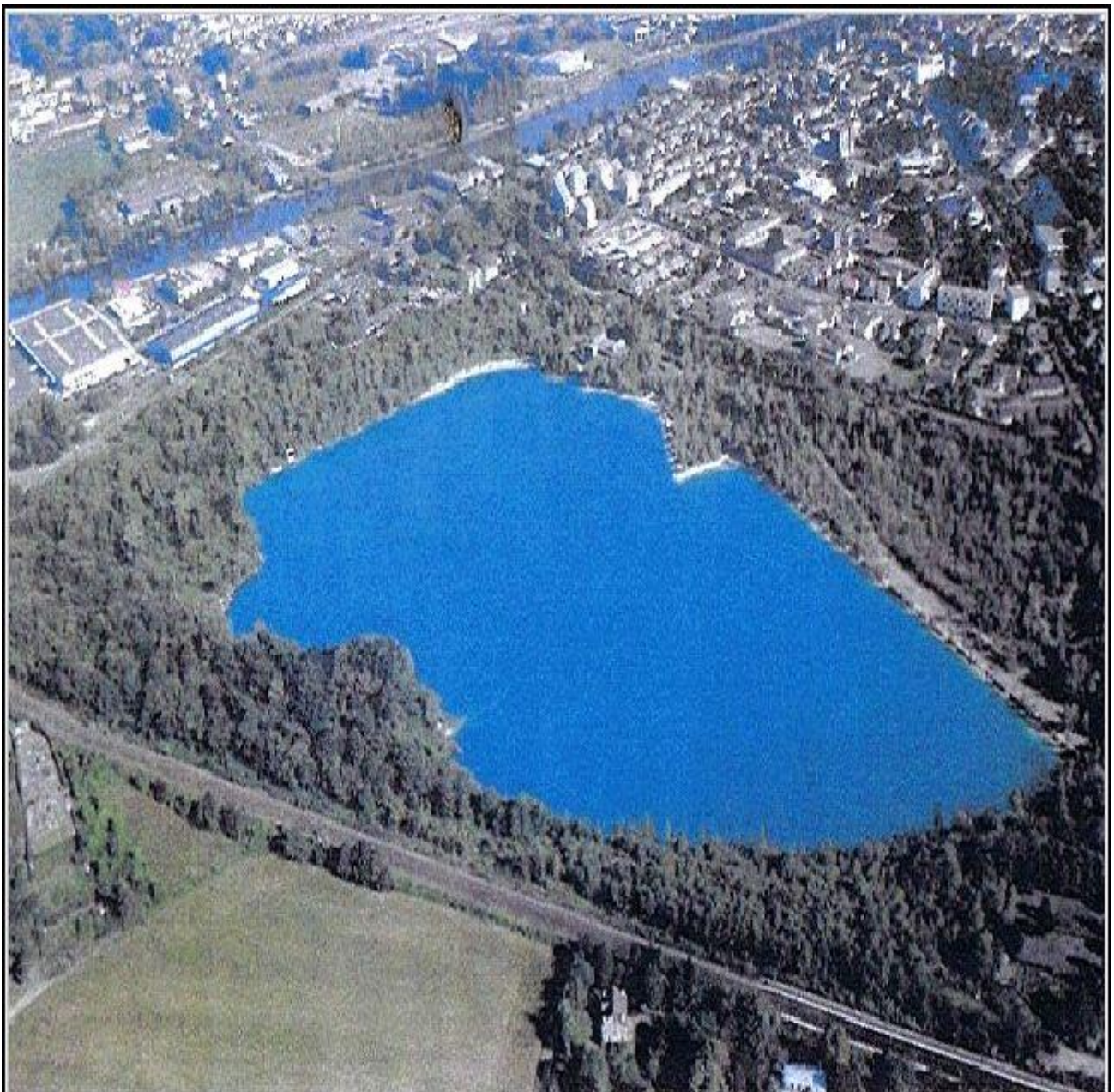
Lac de Beaumont-sur-Oise